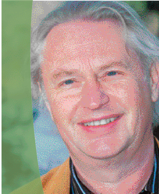
Canton de Cléguérec